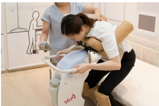
移乗動作をロボットがサポート